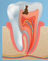
Stade 2 Atteinte de la dentine Sensibilité sucre/froid